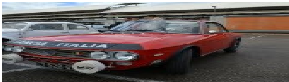
Les automobiles de plus de trente ans sont exposées.

Journée 9€, renseignements : www.paysdegex-montsjura.com