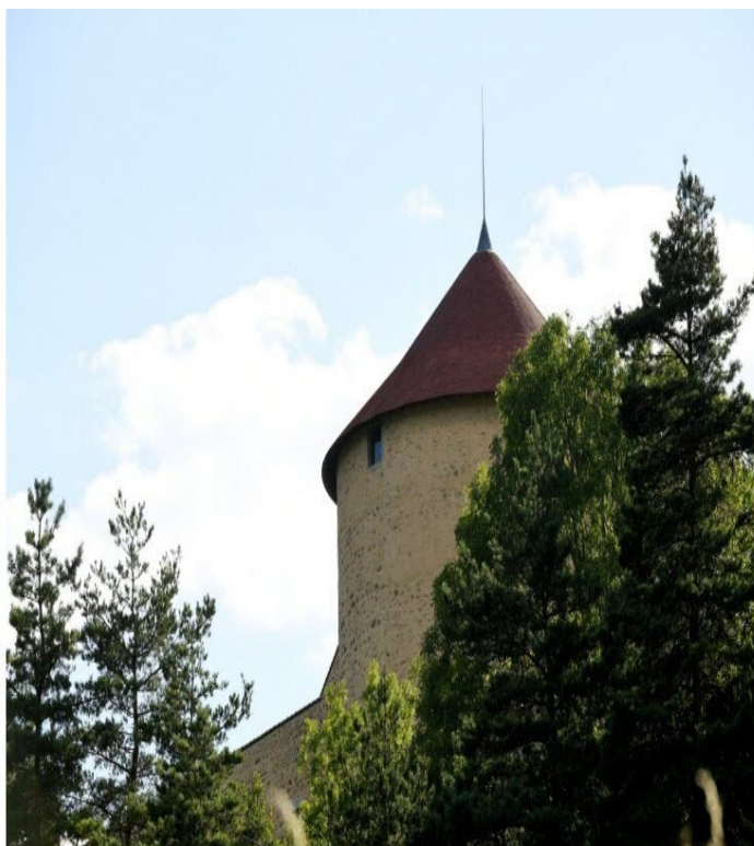
Rendez-vous au château des Allymes pour une journée culture.

Le Progrès - Hier à 19:32 | mis à jour hier à 19:47 - Temps de lecture : 3 min